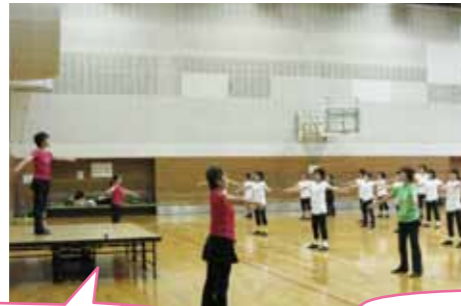
各教室におろす実技研修を真剣に受けます。「生徒さんへの指導は、ここをこうして・・・」