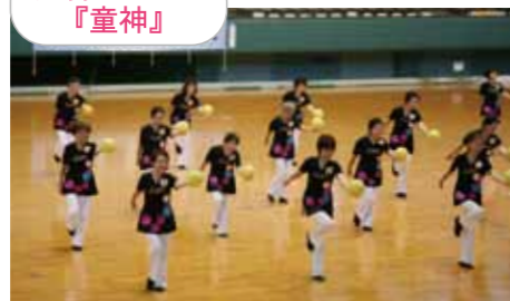
池谷チーム A 『童神』