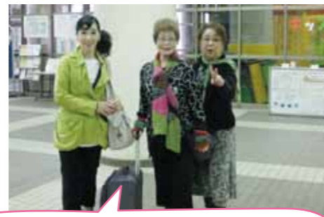
おつかれさま～今日も充実した一日でした！さあ、お次は指導士仲間の交流会へ(^^-)~~~~