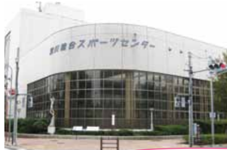
今日も体操演けの一日、頑張ります(^_^)

健康体操ラムーヴの指導士は、月に一度勉強会を行っています。今回の特集はその「研修会」をご紹介します。東京都荒川区の「荒川スポーツセンター」にて研修会の一日がスタートです。