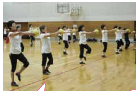
いよいよ迫って来た体操祭。練習にも熱が入ります。