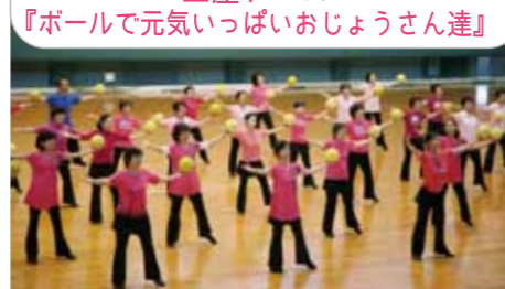
土屋チーム 『ボールで元気いっぱいおじょうさん達』