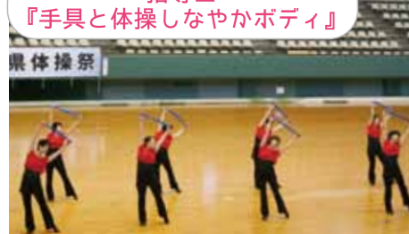
指導士 『手具と体操しなやかボディ』