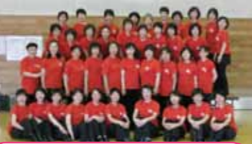
フェスティバルPRの為に作った「15周年ガンパロー! Tシャツ」で気合いを入れた指導士一同